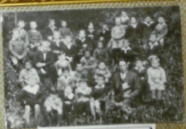
Auf diesem Bild sind viele der Angehörigen zu sehen, die mitgenommen wurden (1. 11. 1940)