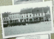
GERMANIA (Polen) Verweilung in SA-SS