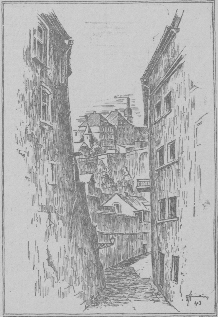
Blick aus der Plättisgãss

„Ma mir furen dach gudd zuesammen, an d'Mamm stét nach fest op de Bén. Sche'ner ewe' elo kóntt én sech et net wónschen. Wann ech dann eppes an d'Haus de't bringen, wat sech matt kengem de't verdon? Du wéss jo we' de' mécht haut erzu gin. Frei Hand an iwerall d'gro'sst Wurt ze fe'eren. Net ewe' ons Mamm, de' kén am Haus he'ert, ower hire Gésch, spirt é yum