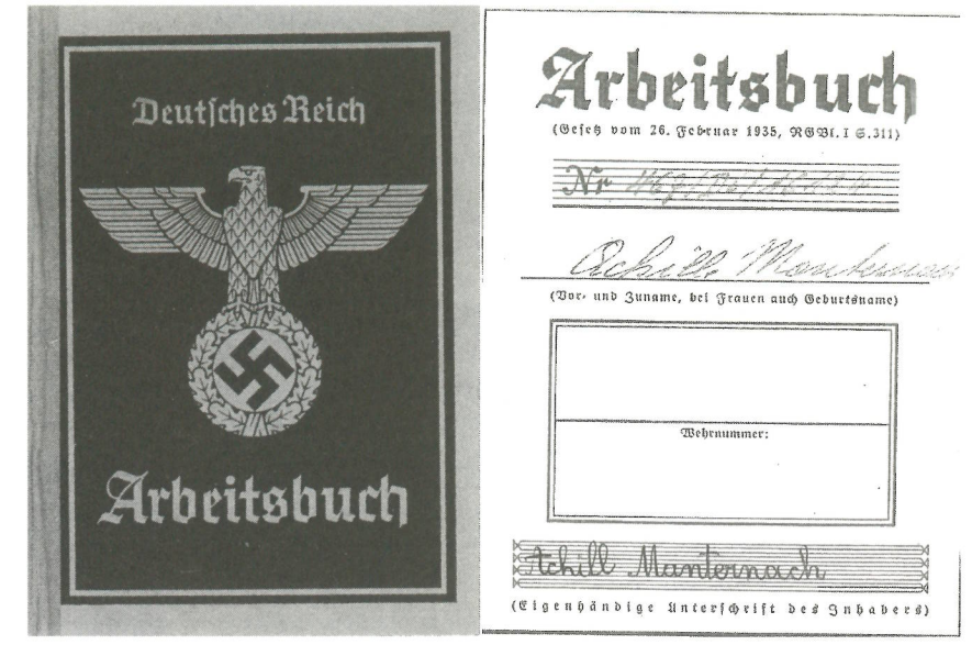
D'Arbeitsbuch vum Achille Manternach, dem Brudder vum Vicky Manternach