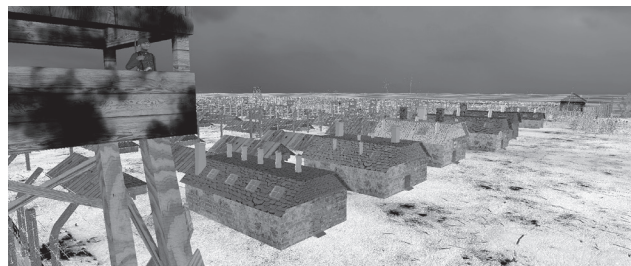
D'Lager 188 an der Viirstellung vum Artist Jean-Roland Lamy-auro-Rousseau