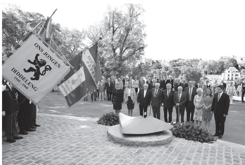
Bei der Gedenkzeremonie virum Monument vun der Nationaler Solidaritéit um Kanounenhiwwel