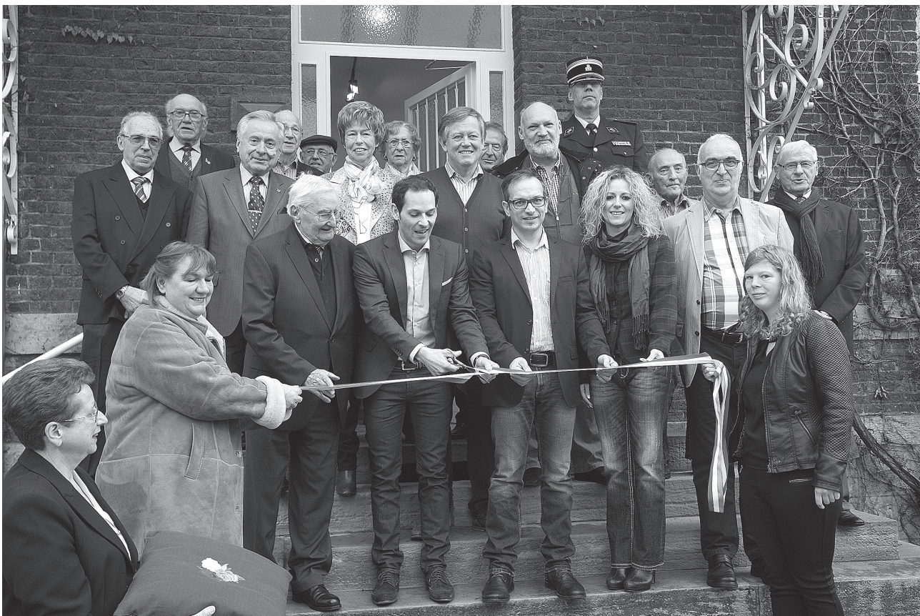
Bei der Ouverture vum Musée op senger neier Adress: d'Gemengenautoritéiten mat den Éieregäscht an de Verrieder vun der Zwangsrekrutéiertesektioon.