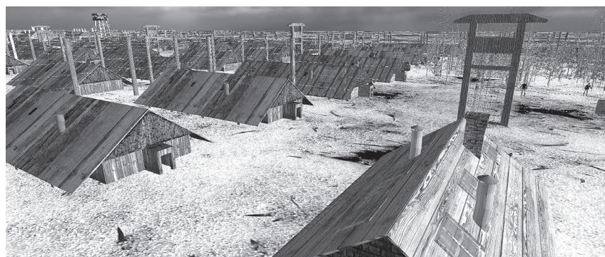
D'Lager 188 an der Viirstellung vum Artist Jean-Roland Lamy-au-Rousseau