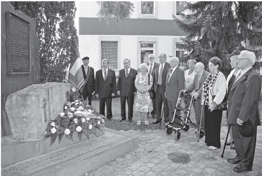
Den Ufank gouf am klengen Krees zu Hollerech beim Memorial vun der Deportatioun gemat