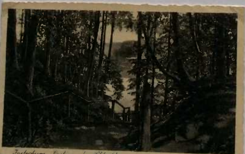
Duderburg, Kurve in den Schluchtlern

In der Welt von heute hängt der Wohlstand eines jeden Volkes vom Wohlstand aller anderen ab. Es kann keinen dauernden Frieden und keinen Wohlstand geben, solange ein Volk versucht, sich zum Herrenvolk zu machen. In der Roosevelt-Churchill-Erklärung haben sich England und die Vereinigten Staaten in ihrem eigenen Interesse verpflichtet, nach dem Kriege keine wirtschaftliche Benachteiligung der Unterlegenen zuzu-