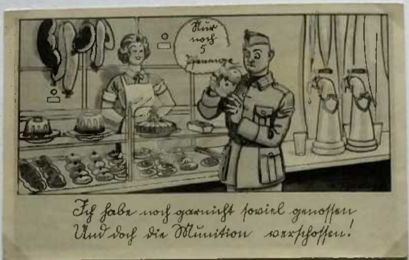
Pionier Penatus Bierer