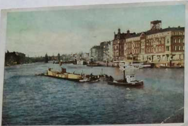
Stettin - Am Ballpark