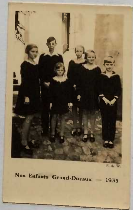
Nos Enfants Grand-Ducaux — 1935