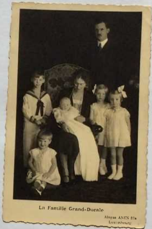
La Famille Grand-Ducale