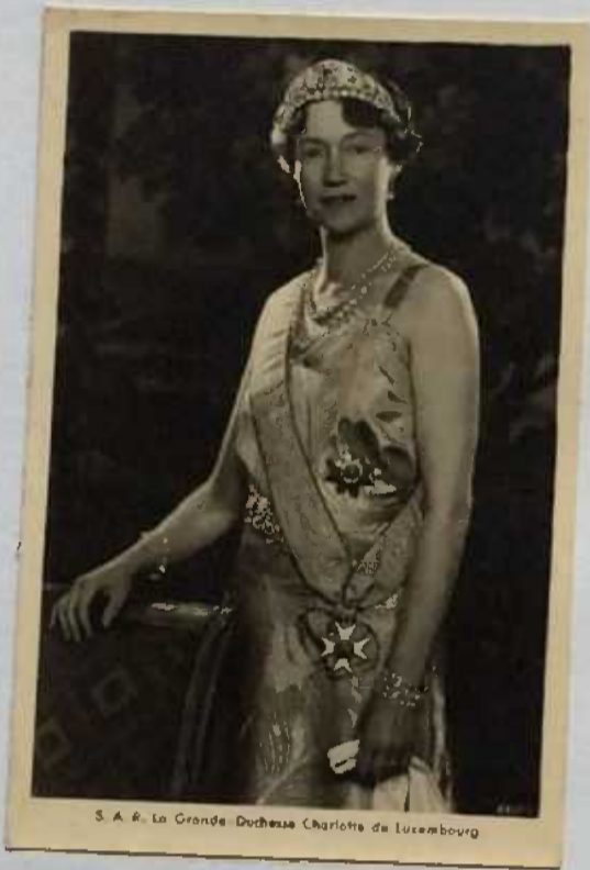
S. A. R. La Grande Duchesse Charlotte de Luxembourg