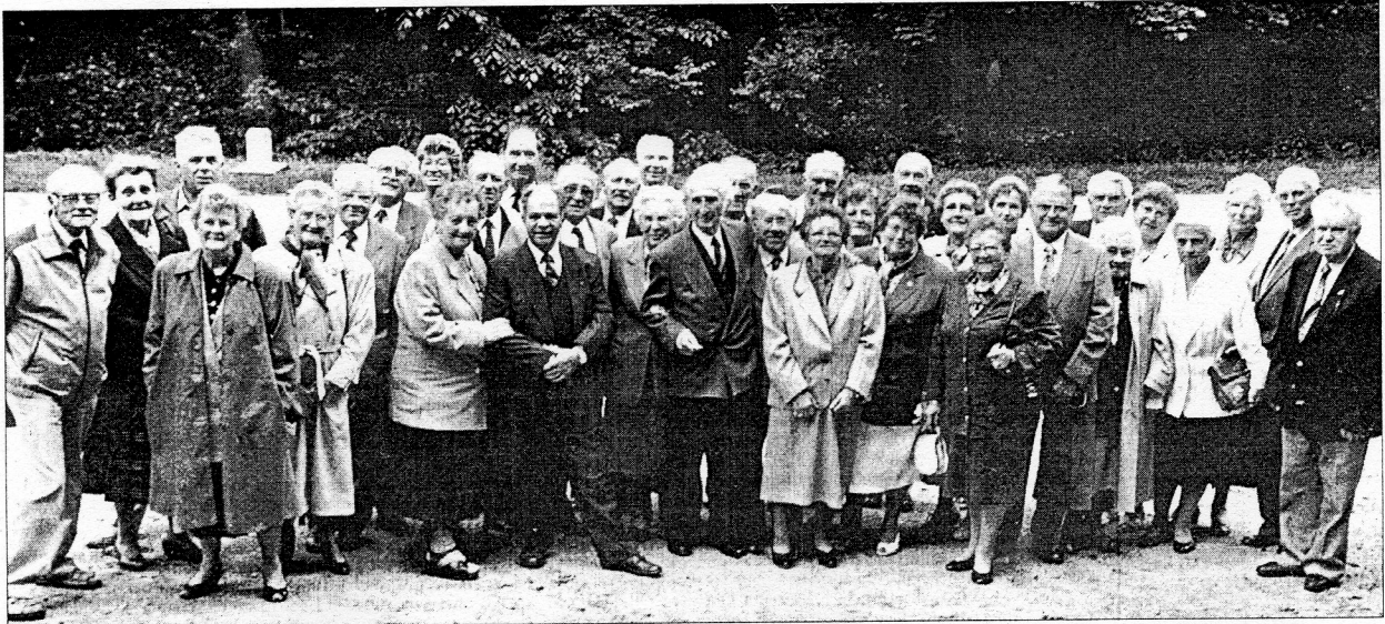
Ambiance de chaleureuse amitié pour les enrôlés de force et leurs familles.

Les anciens enrôlés de force luxembourgeois, casernés à Gorodok, situé à 28 km de Witebsk en Russie, se sont retrouvés pour la 27e fois.