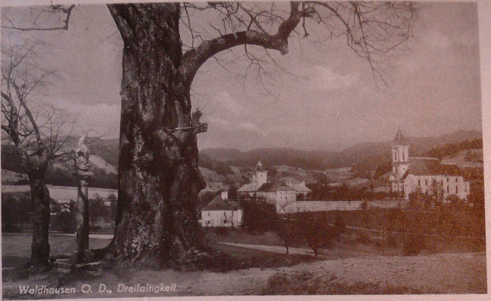
Waldhausen O. D., Dreifaltigkeit