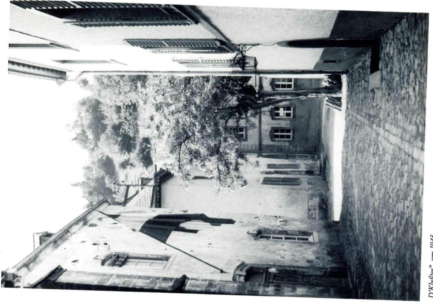
„D’Klyster“, um 1945