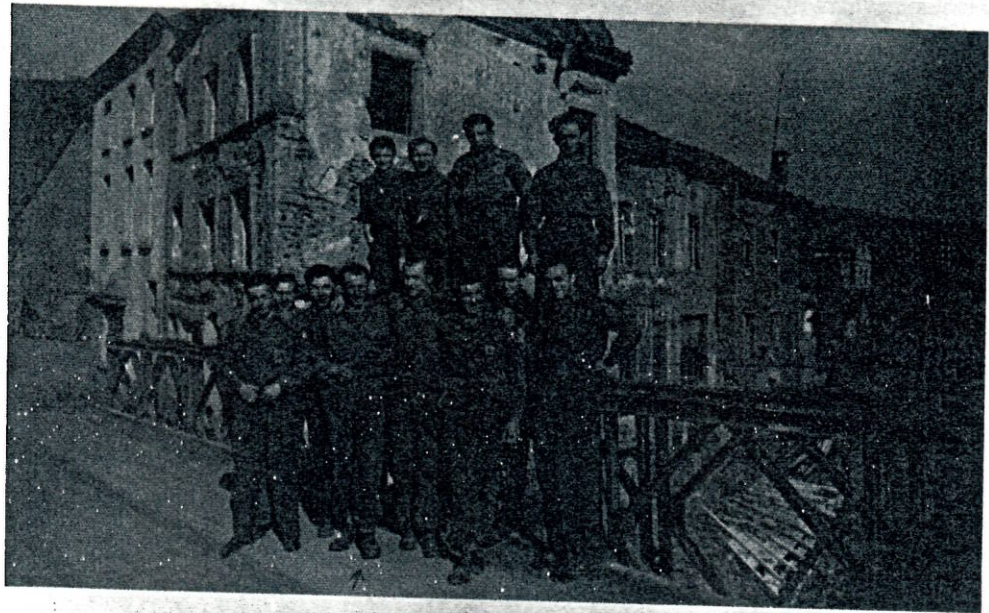
op de Nutfbreck Febr. 1945