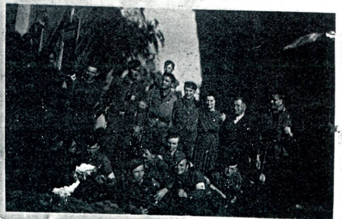
L. Weiner Miliz ant Kluster e isem Hauptquartier Sept. 1944