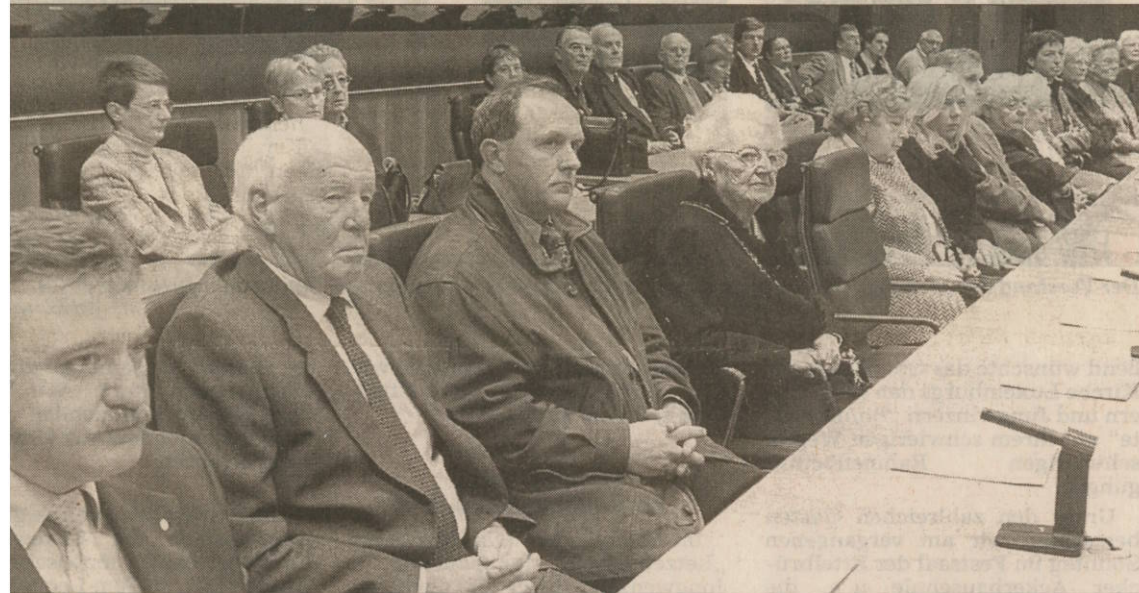
Familienangehörigen der Patrioten nahmen die Auszeichnung aus den Händen von Premierminister Claude Juncker in Empfang

62 Luxemburger Patrioten posthum mit der „Croix de la Résistance“ ausgezeichnet