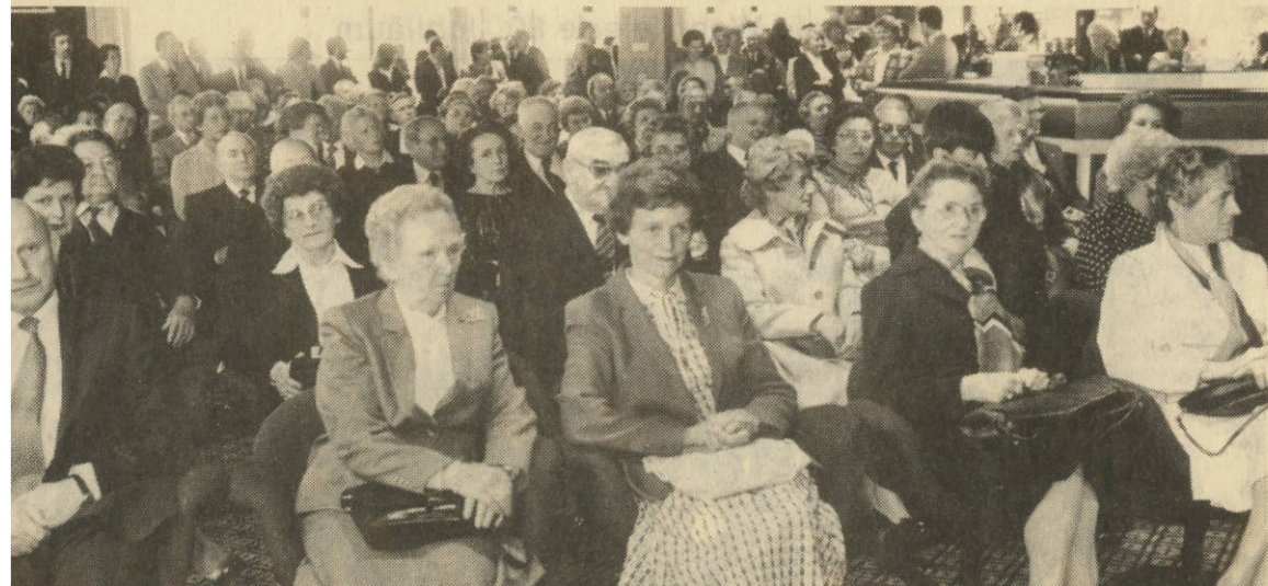
Personen wurde gestern im Rahmen einer Feierstunde der „Titre de l'ordre de la Résistance“ verliehen