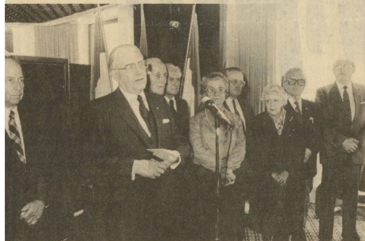
Staatsminister Pierre Werner bei seiner Ansprache

(t) - Bei Gelegenheit des in den letzten Wochen und Monaten gelaufenen 40. Jahrestages der Befreiung unseres Landes vom Nazijoch sind gestern nachmittag zahlreiche ehemalige Resistenzler und Angehörige verstorbener Widerstandskämpfer in den „Kleng Kueb“ auf Kirchberg gekommen, um aus den Händen von Staatsminister Pierre Werner die Auszeichnungen „Titre de la Résistance“ entgegenzunehmen.