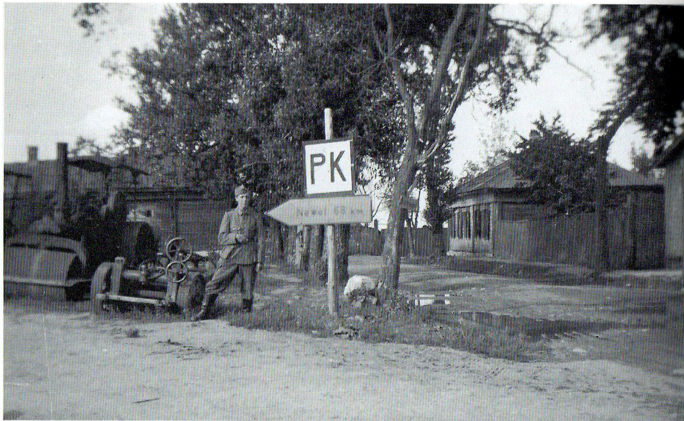
De Roby Geisen zu Gorodok a Russland. Bis op Nevel as et nët méi wäit.