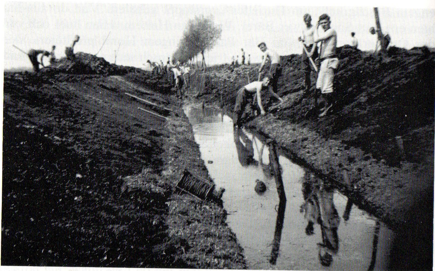
RAD-Männer am Asaz