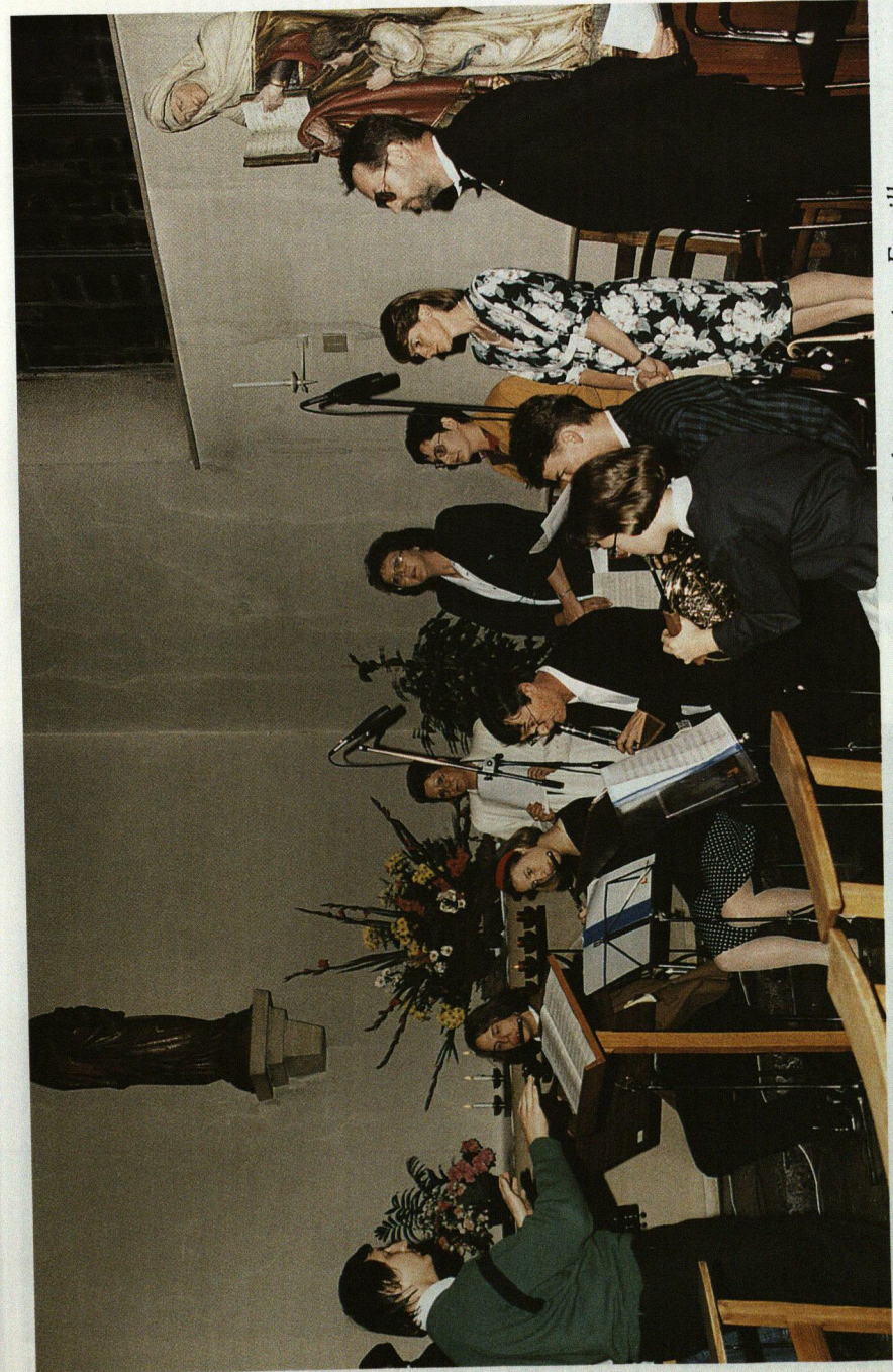
Eng ganz besonnesch feierlech Mass, gesongen an orchestriert vu Mëmberen aus eiser Famill