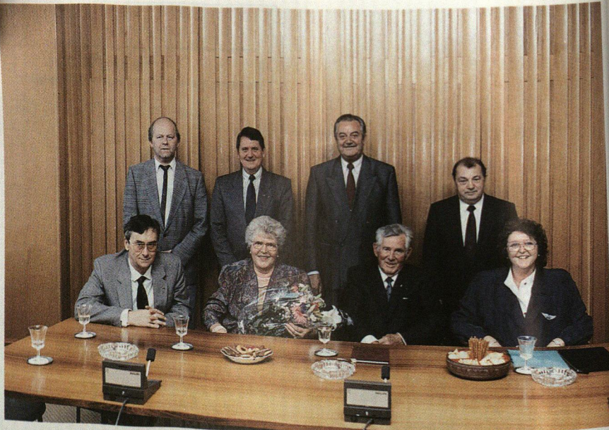
Receptioun duerch de Schefferot op der Gemeng