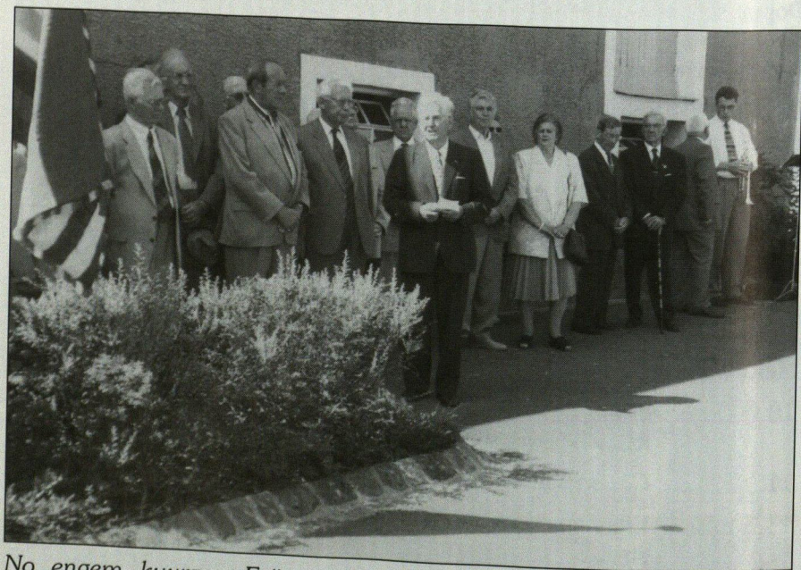
No engem kuerzen Erënnerungsmoment virum Haus Tompers, de Chant des Partisans an d'Hemecht.