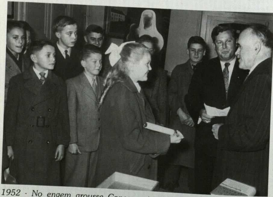
1952 - No engem groussen Concours iwwer d'Verhalen am Stroosseverkéier hun ech dem Unterrichtsminister Pierre FRIEDEN (†) d'gewënner vum Concours virgestallt.

Auch unser „Code de la Route“, heute sicher das am weitesten bekannte Gesetz unserer legislativen Maschinerie überhaupt, stammt ja aus jener Zeit der verkehrstechnischen Umschaltung vom Kollektiv- auf den Individualverkehr.“