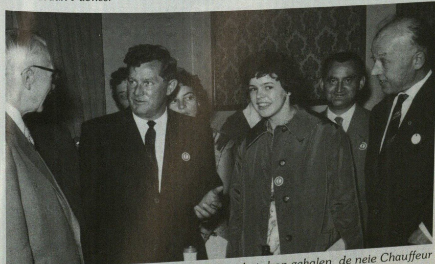
De Präsident vun der Handwierkerkammer hat drop gehalen, de neie Chauffeur mat der Führerschäinnummer 100.000 virgestallt ze kréien.