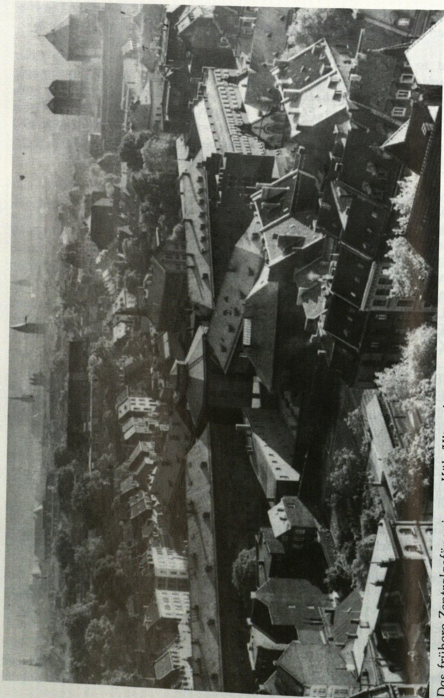
Das frühere Zentralgefängnis von Köln/Klingelpütz mit seiner Hinrichtungsstätte