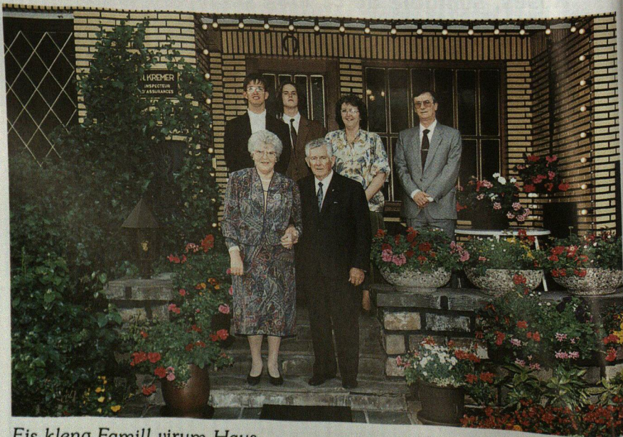
Eis kleng Famill virum Haus