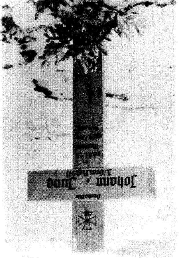
Dem Jean sui Graf a Russland