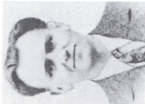
De Wagnesch Jemp, e gudden treie Patriot, deen émmer an iwerall gehollef huet

Ouni déi zwā léif Leit hatt de Bunker Friedbésch am Éislek nēt léinne bestoen. Hiren Asatz an de Risiko wore grouss an eenzeg, awer de Merit an d'Uerkenntung wore kleng!