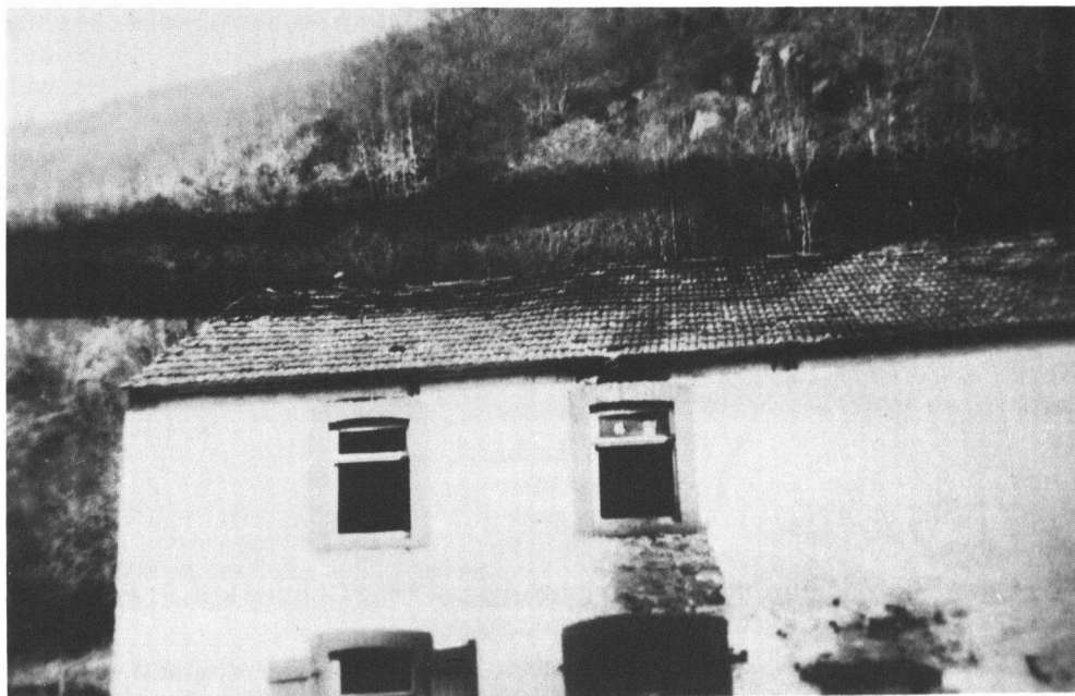
Der Bomi hiirt Haus an der ieweschter Schlänner, wou d'Gestapo 4 Jongen iwerrompelt hat