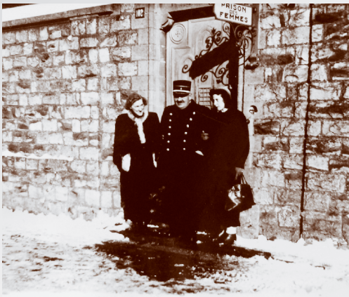
Foto vom Eingang

Im Herbst 1945 wurde das Frauengefängnis nach Limpertsberg ins Kloster der Klarissinnen verlegt, da die Anstalt im Grund einfach zu klein geworden war.