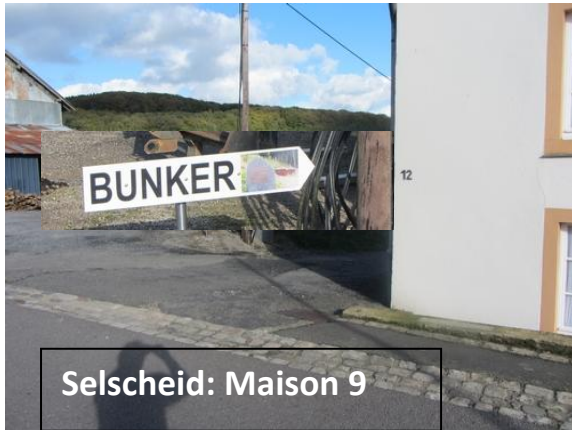
Selscheid: Maison 9