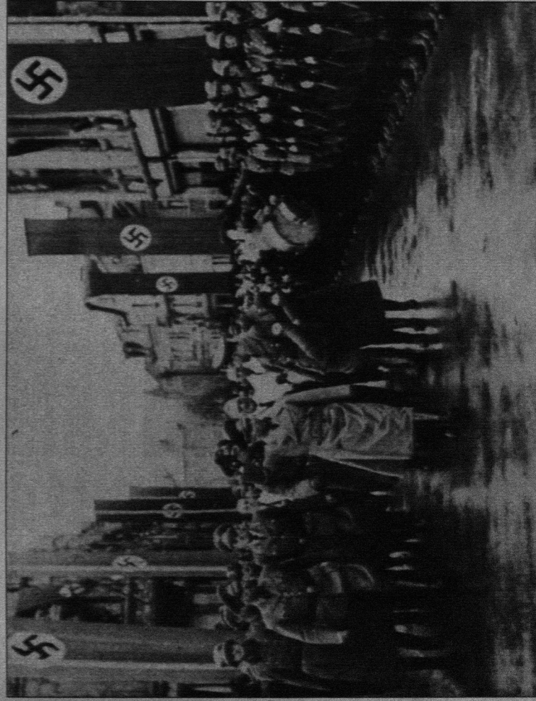
Wehrmacht und Partei geeint bei der Abnahme der „Forge du Sud“ Düdelingen. Vornweg Gauleiter Gustav Simon, die halbe Portion. Ihn (bzw. sie) wird auf Ersuchen von Minister Bodson eine vierköpfige Abordnung aus Luxemburg aus dem Knaust von Puderborn „befreien“. Beim Überqueren der Bortels-Brücke in Echternach aber hatte der Westentaschenbaum bereits alle gestiefelten Viere von sich gestreckt.

*) Die genaue Zahl der Luxemburger, die vor der deutschen Wehrmacht nach Frankreich flüchteten, wurde nie ermittelt. Halbamtliche Angaben sprechen von nahezu 60 000 Evakuierten, was zu hoch gegriffen sein dürfte. Außer den Réfugiés in der „douce France“ setzte sich in etwa die gleiche Zahl Einwohner aus den Südkantonen in den Norden des Landes ab.