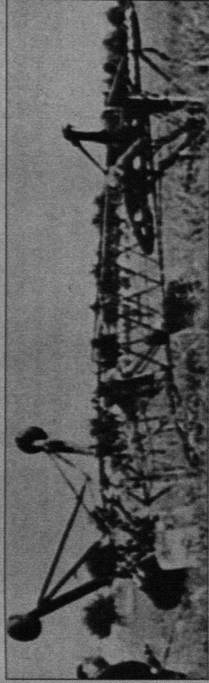
Wie eine auf den Rücken gefallene große Heuschrecke mutet dieser bei der Landung in Foetz zu Bruch gegangene und bis auf das Gestänge ausgebrannte Fiesler Storch an. Die Fi 156 war erstmals Ende Juli 1937 beim Vierten Internationalen Flug-Meeting in Zürich-Dübendorf vorgeführt worden. Sie blieb noch bei 50 kn/h in der Luft. Mit einem Storch wurde am 12. September 1934 Italiens Benito Mussolini aus seinem Gefangnis auf dem Gran Sasso befreit. Mit einem andern Gerät wäre das waghalsige Unternehmen damals nicht zu bewerkstelligen gewesen.

Mit Oberst Hedderich fahren wir zum Einsatzort „Aessen“ hinaus. Armeeminister Emile Krieps, der mit uns gekommen ist, weist auf